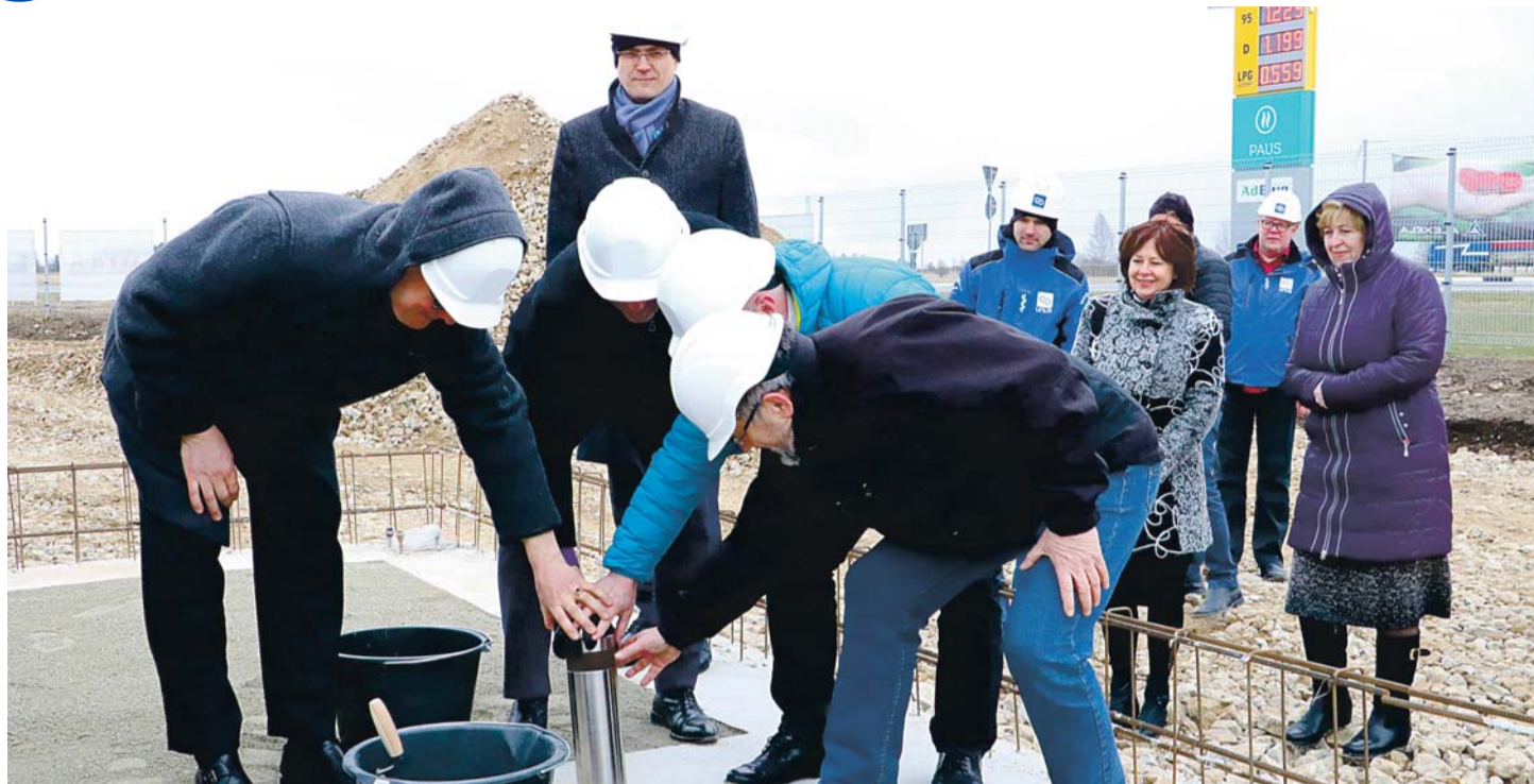
Kikase uus tootmishoone sai nurgakivi.