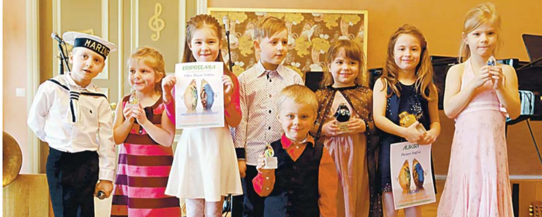
3.-4.- ja 5.-6.-aastased.