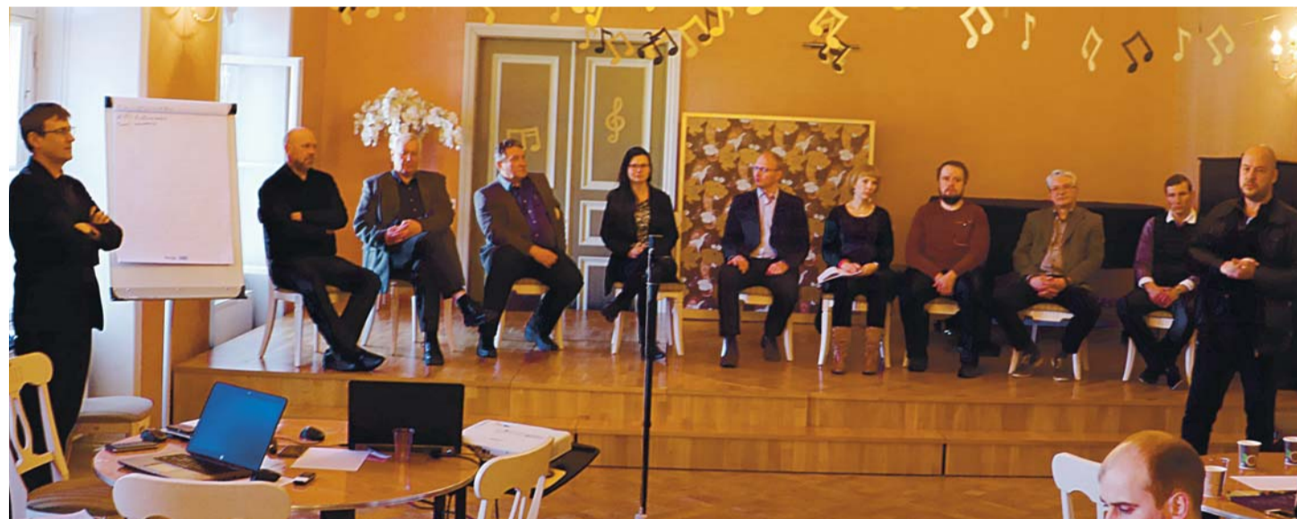
Kostivere kultuurimõisas toimunud esinduslikul konverentsil “Mis saab Linnamäe järvest?” osales aktiivselt poolsada inimest.

1. Linnamäe hüdroelektrijaama kompleksil on suur ava-