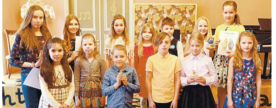
7.-9.- ja 16.-18.-aastased.