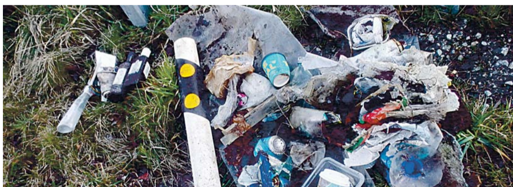
Otsustasime sõbrannaga, et võtame sel aastal osa Kaldad Puhtaks '17 aktsioonist. Ühe täiskasvanu tunni aja saak umbes 40-meetrise lõigult jõe ja tee vahel. Enamus leitud prügist oli selline jääde, mille saaks loodusesse viskamise asemel suunata taaskasutusse.

Tänavu töötas üks tegus seltskond Linnamäe paisjärve kallastel. Kõikvõimalikku prügi oli palju. Poole suure konteinerist kogusime Linnamäe paisjärve n-ö kirdepoolselt kaldalt ja metsatukast ca 200 m ranna-joone pealt neljakesi 4 tunniga.